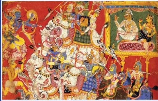
Arjuna en Krishna - De mythische slag bij Kurukshetra

De Alternatieve Wegen & Vrijmetselarij - New Age - Illuminisme - Nieuwe Wereldorde