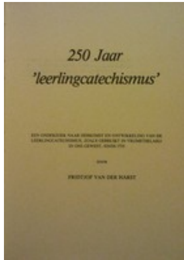
250 jaar leerling-catechismus, Van der Harst

Dit standaardwerk was alleen nog tweedehands verkrijgbaar. Verhelderend voor wie interesse heeft in de discussie rondom het 'nieuwe' ritueel van 'loge Socrates'.